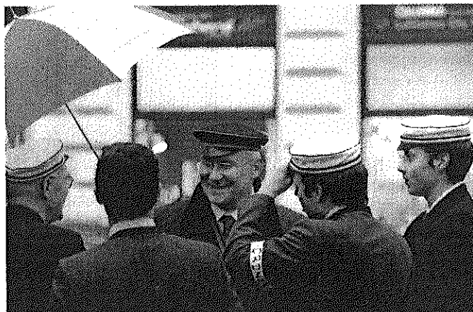
Nationalratspräsident und Burschenschafter Graf „Der kleinkarierten Vorstellung einer österreichischen Nation entgegenzutreten“

Die Olympia ist ein rechtsextremer Stoßtrupp im deutschnationalen Milieu. Auf gesamtdeutschen Burschenschaftstreffen stellte sie Anträge „gegen die Unterwanderung des deutschen Volkskörpers durch Ausländer“ (1991).