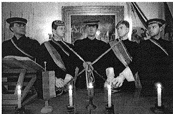
FPÖ-Mandatar Stefan (rechts außen) im Kreise von Burschenschäftlern „Ich fühle mich als Deutscher“

Die Olympia wurde ein Jahrzehnt nach den revolutionären Bestrebungen von 1848 gegründet, fand sich aber bald aufseiten der deutschnationalen Reaktion. Mit Hitlers Machtergreifung in Deutschland übernahm die Olympia das Führerprinzip. Nach einer Untersuchung des Histori- ▶